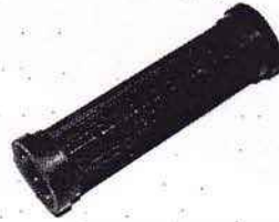
Maico; NSU usw.