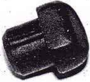
Anschlaggummi Gabel DKW NZ