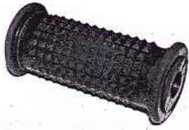
Hercules; Victoria; Zündapp usw.