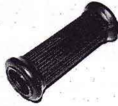
ILO; Triumph; Victoria usw.