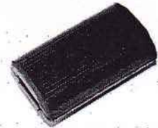
BMW (alle Modelle)