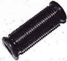
Fichtel & Sachs 50 - 175