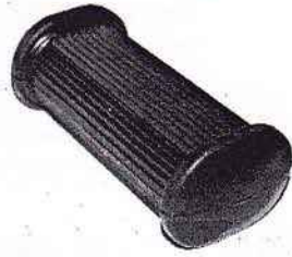
Soziusraste oval 1-seitig geschl.