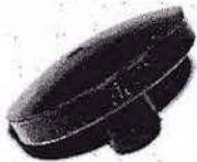
Stutzpilz dünn Zundapp 200