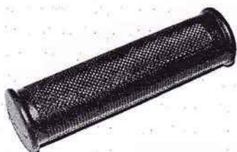
Griffgummi Magura o. Wulst Ø22