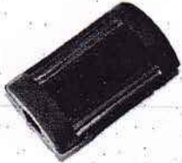
F&S; NSU; Maico usw.