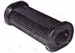
Soziusraste oval beidseitig offen