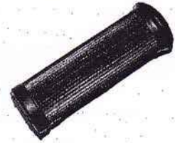
Zündapp (alle Modelle)