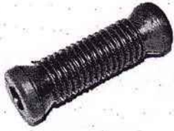
DKW RT 100/125