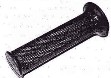
Griffgummi Magura m. Wulst Ø22