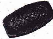
ILO; Victoria usw.